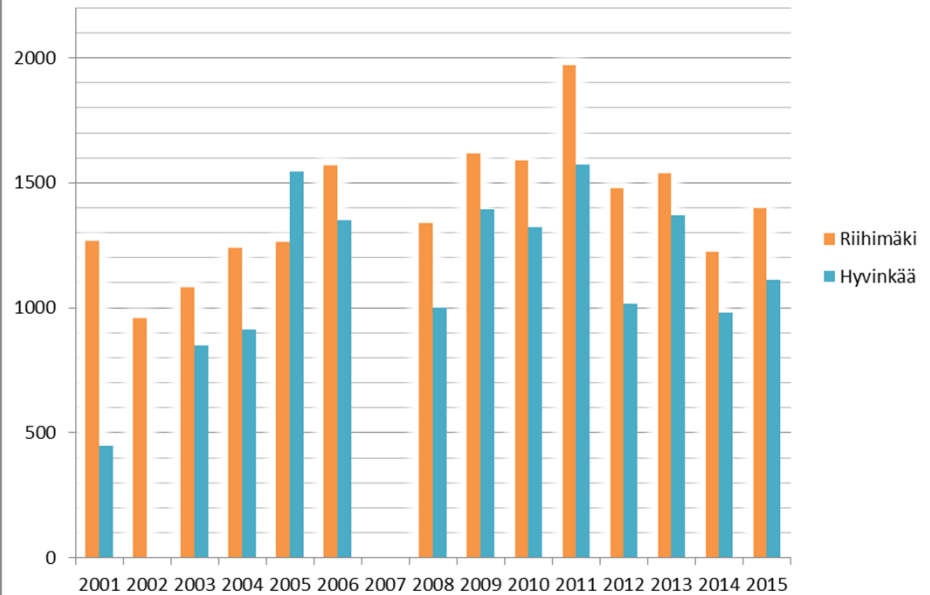
PYÖRILLÄ ILMAN MOOTTOREITA -KISAN TULOKSET